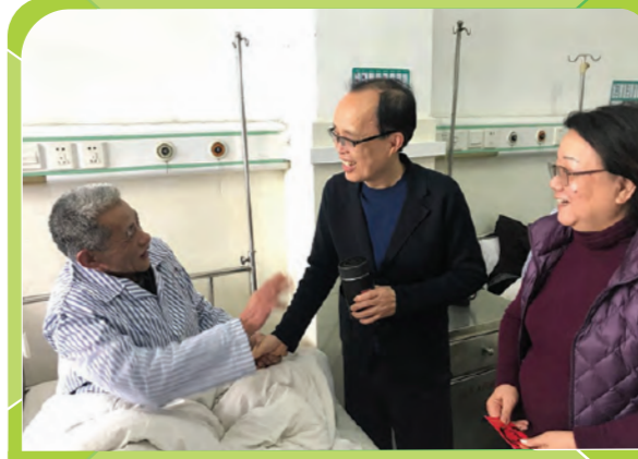
2019年基金主席及其丈夫親自到醫院探望接受「復明希望工程」免費白內障手術的患者。