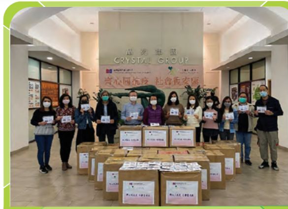
玉清慈善基金聯同晶苑國際集團有限公司，捐贈十萬個口罩予十七間社福機構。