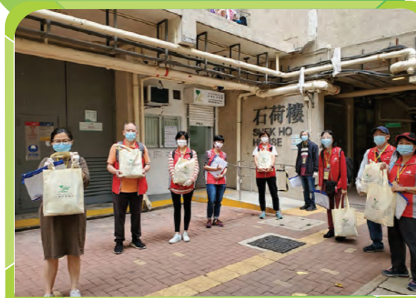
基金設立食物及物資支援中心，派發食物給石圍角邨的長者。