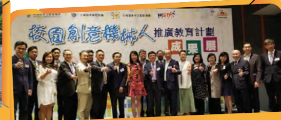
「校園創意機械人」活動大合照