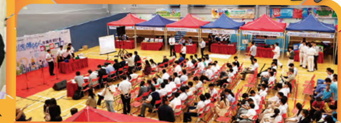
「校園創意機械人」活動花絮

大埔區中學校長會自1997年成立，致力關心香港、國內及國外教育發展及趨勢、提昇教育同工專業發展及培育青少年成長。多年來與區內中學、政府部門及各工商社福界別攜手協作，開展多項創新及具前瞻性的計劃。當中包括：大埔區中六聯合招生計劃(1999-2010)、中文科單元教學先導計劃(2002)、大埔區校園驗毒試行計劃(2009-2011)、健康校園測檢計劃(2011-)、校際龍舟邀請賽禁毒盃(2011-)、藝術表演培訓計劃(2013-)、大埔青年藝術節(2015-)、校園創意機械人推廣教育計劃(2016-2019)及創科@大埔(2019)等項目。