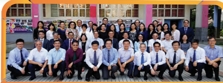
教育局局長楊潤雄先生與中小學校長大合照